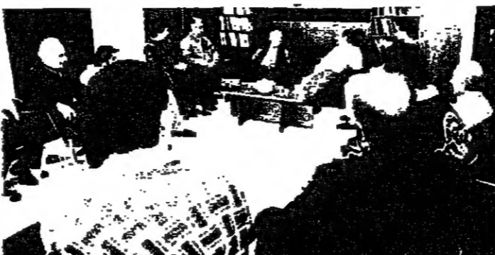
مع وفد موظفي المطاعم والفنادق